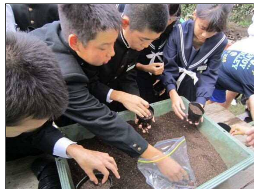
苗木のスクールステイ