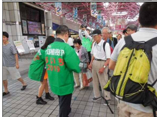
開催決定PRキャンペーン（8月23日）