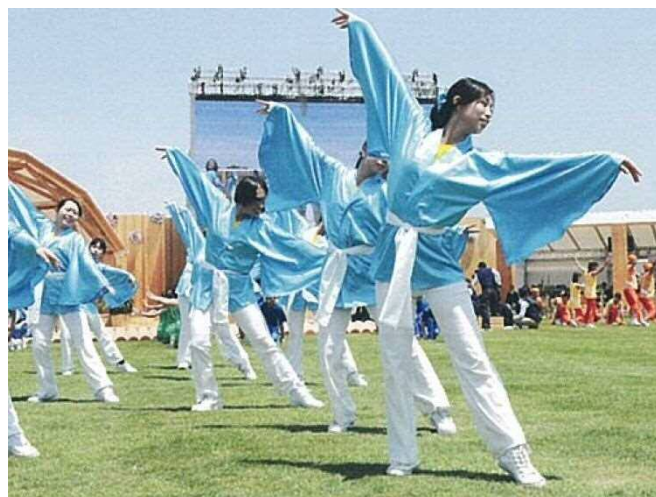
アトラクションの状況