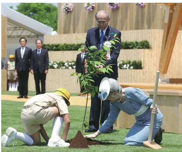
天皇皇后両陛下お手植えの状況