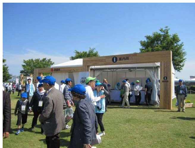
おもてなし広場の状況