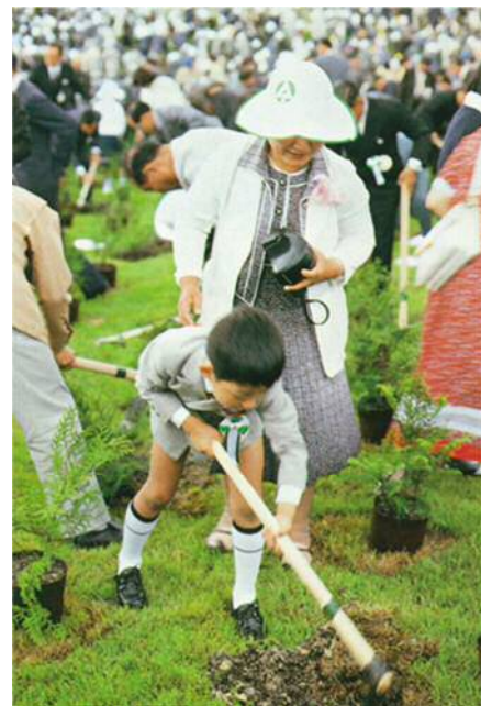
一般招待者の植樹の状況